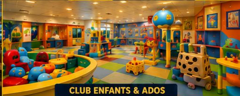
CLUB ENFANTS & ADOS