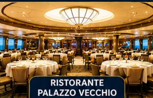
RISTORANTE PALAZZO VECCHIO