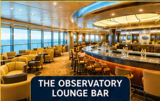
THE OBSERVATORY LOUNGE BAR