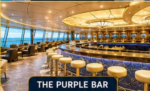
THE PURPLE BAR