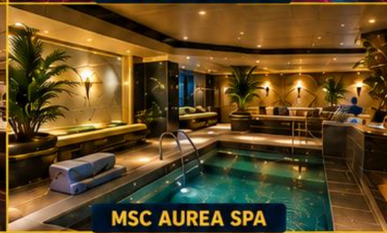
MSC AUREA SPA