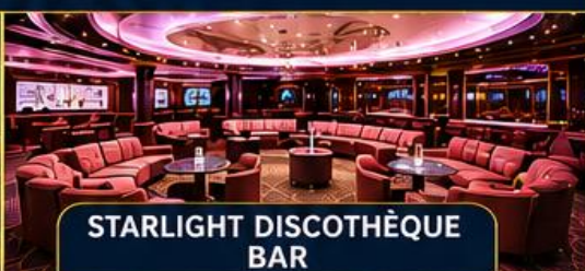
STARLIGHT DISCOTHÈQUE BAR