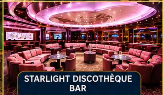
STARLIGHT DISCOTHÈQUE BAR