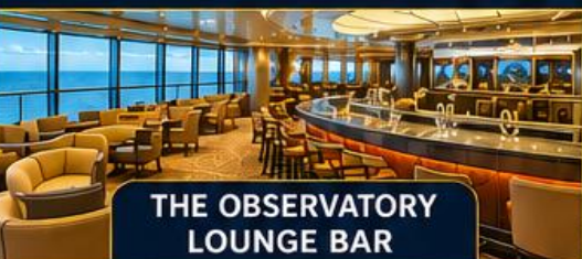
THE OBSERVATORY LOUNGE BAR