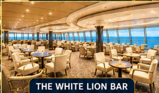
THE WHITE LION BAR