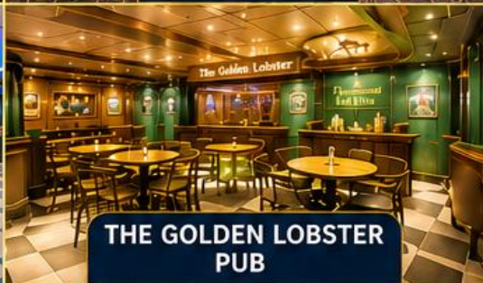
THE GOLDEN LOBSTER PUB