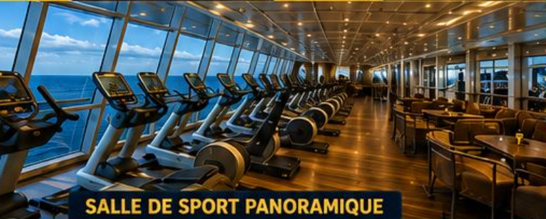
SALLE DE SPORT PANORAMIQUE