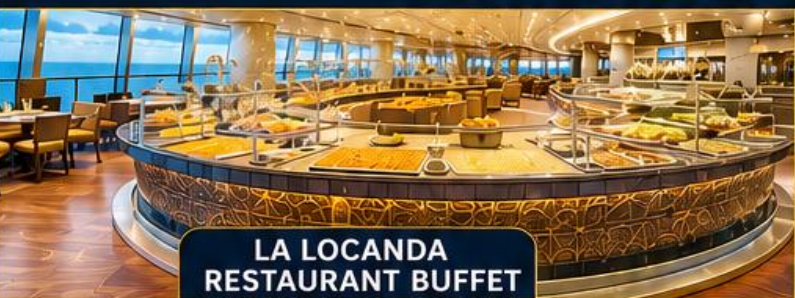
LA LOCANDA RESTAURANT BUFFET