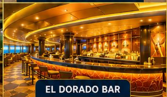
EL DORADO BAR