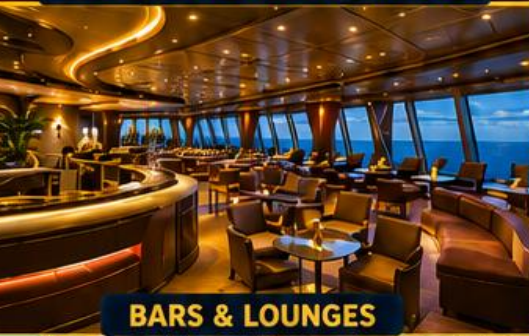
BARS & LOUNGES