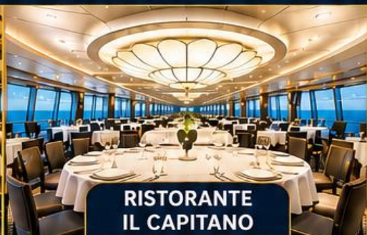
RISTORANTE IL CAPITANO