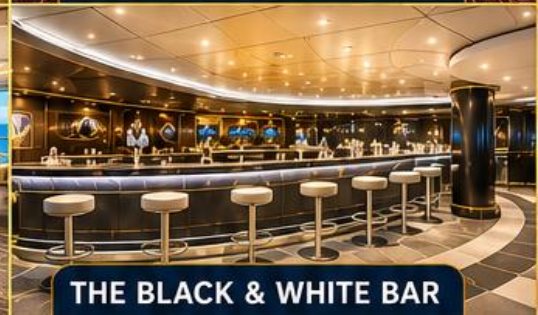
THE BLACK & WHITE BAR