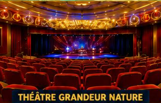
THÉÂTRE GRANDEUR NATURE