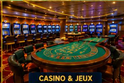
CASINO & JEUX