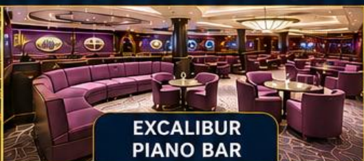
EXCALIBUR PIANO BAR