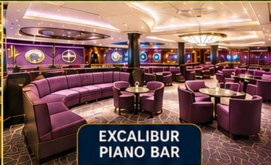
EXCALIBUR PIANO BAR