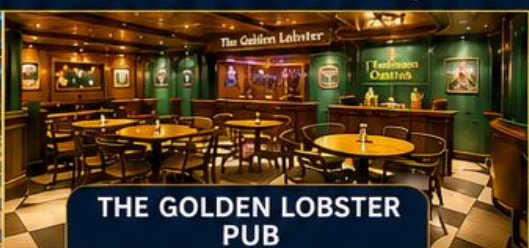
THE GOLDEN LOBSTER PUB