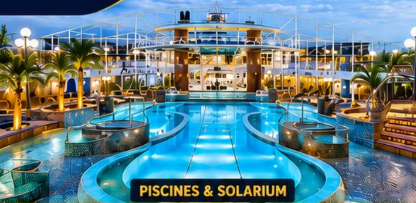
PISCINES & SOLARIUM