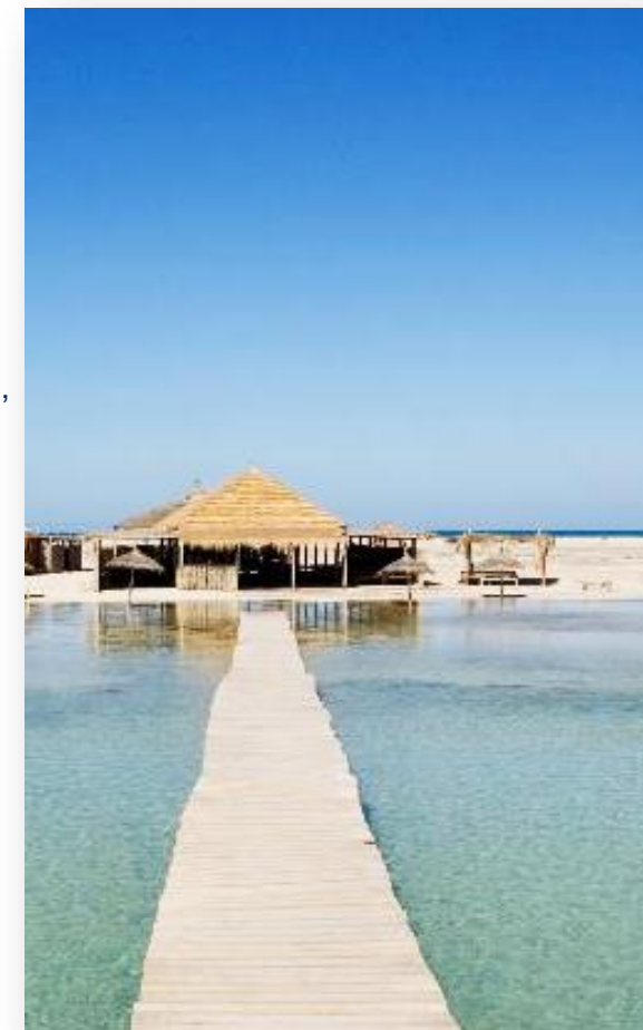
Températures moyennes en journée (Île de Djerba)

Avenue 14 janvier au dessus de la biat Khezama Khezama 4011 Tel. 73272503 +216 73 272 500 +216 73 272 501