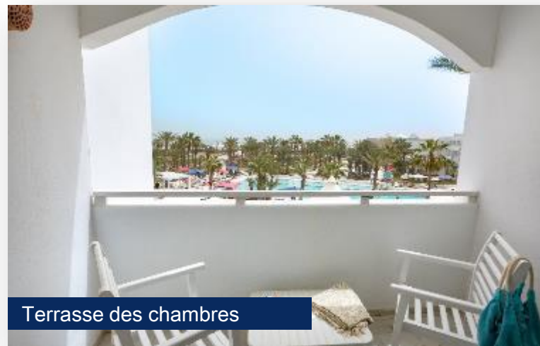
Terrasse des chambres